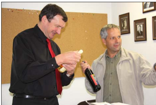
A borok átadása