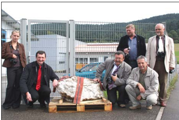
Csoportkép az emlékkő mellett